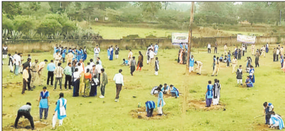
पौधरोपण अभियान में शामिल लोग।