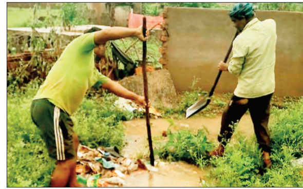
जल निकासी के कार्य में जुटे कर्मी।

भरतपुर ब्लॉक में डेढ़ दर्जन से ज्यादा चिकित्सकों की कमी है। डॉ. आरके रमन, बीएसओ जनकपुर