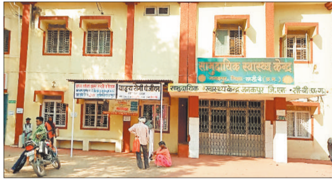
सामुदायिक स्वास्थ्य केंद्र जनकपुर।

भरतपुर ब्लॉक के अंतर्गत आने वाले कई दूरस्थ गांवों में प्राथमिक स्वास्थ्य केंद्र एवं उप स्वास्थ्य केंद्र केवल भवनों तक ही सीमित होकर रह गए हैं। डॉक्टरों की पदस्थापना नहीं होने से मरीजों को इलाज के लिए कई किलोमीटर दूर जिला अस्पतालों या नगरीय क्षेत्रों का रुख करना पड़ता है। स्थिति इतनी गंभीर है कि कई बार समय पर इलाज न मिलने से मरीजों की जान पर भी बन आती है। डॉक्टरों के अलावा नर्स, लैब टेक्नीशियन, दवाइयां और एंबुलेंस जैसी बुनियादी सुविधाओं का भी अभाव है। विकासखंड मुख्यालय जनकपुर में स्थित इकलौते सामुदायिक