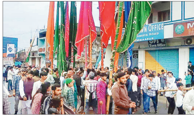
जुलूस में शामिल समाज के लोग।